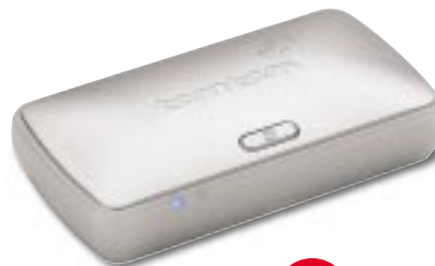
Récepteur GPS filaire